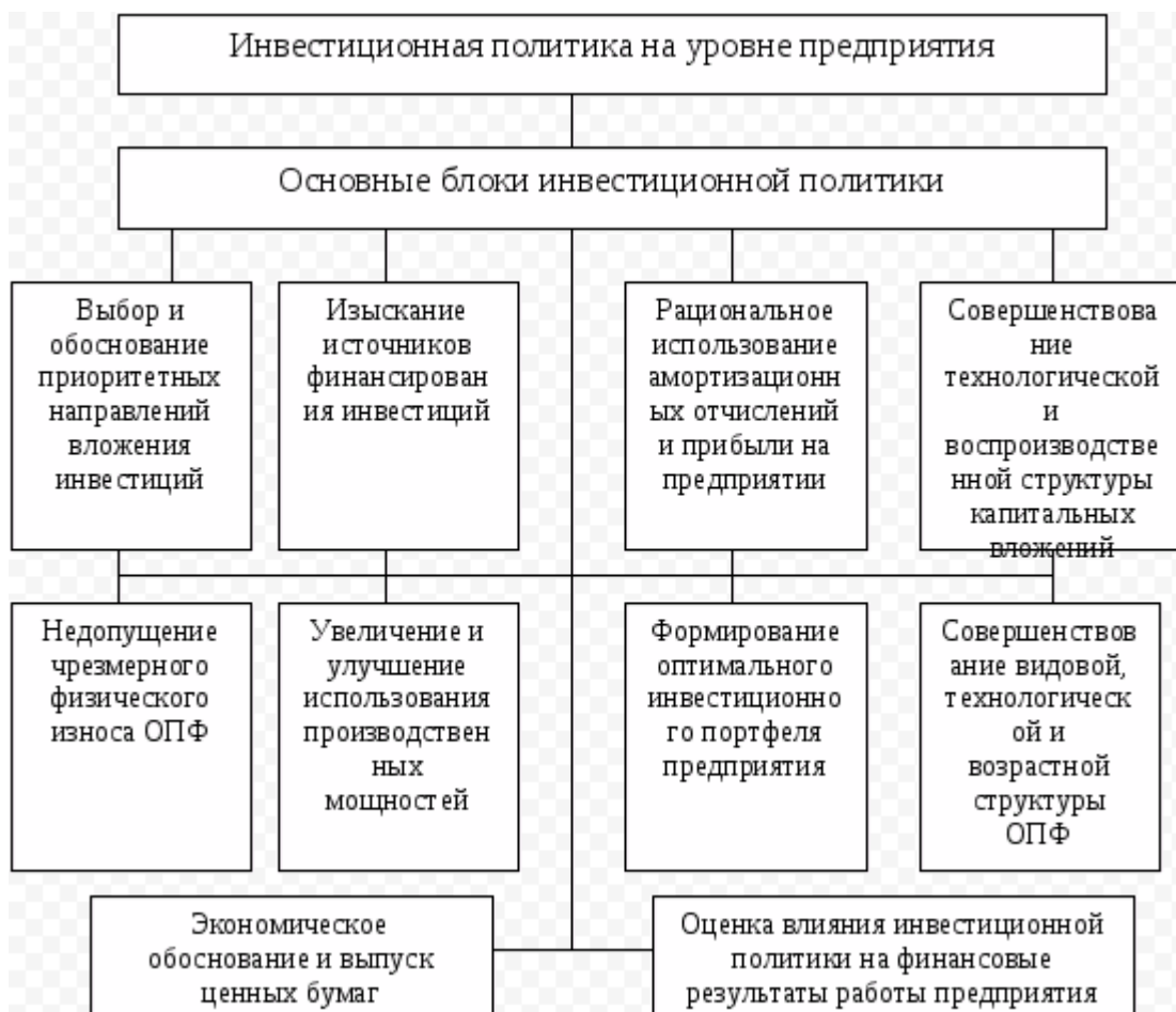
Рис. 1. Структура инвестиционной политики предприятия

При разработке инвестиционной политики на предприятии необходимо придерживаться следующих принципов: